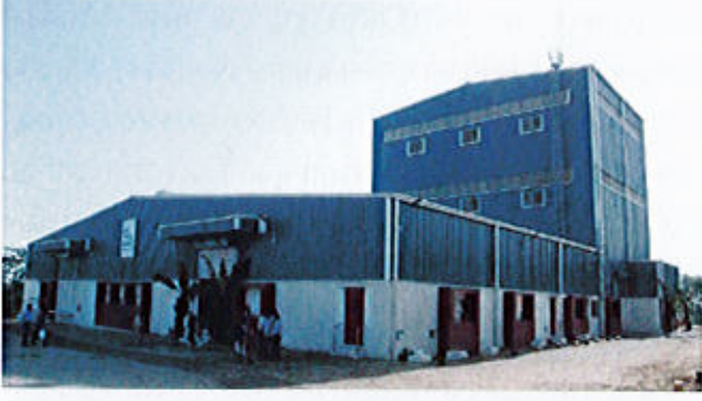
एनआरपीएल स्थल पर पैलेटाइजेशन संयंत्र का साइड व्यू