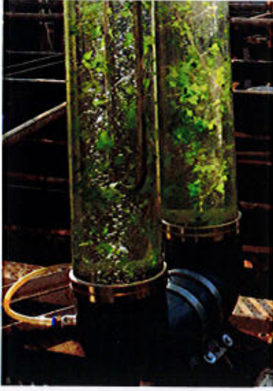
कम ऊर्जा दक्ष स्पार्जिंग सिस्टम के साथ एअर-लिफ्ट ट्युबलर